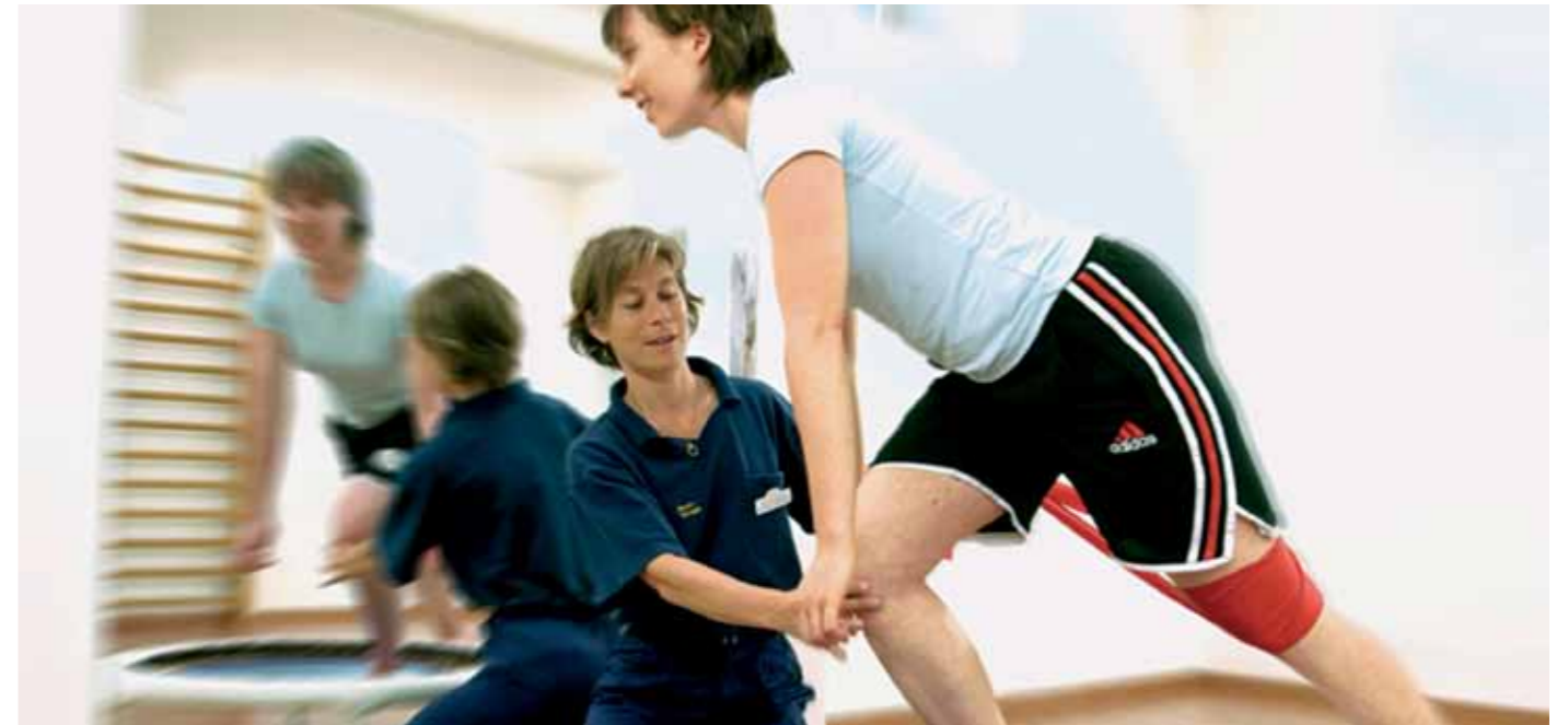
Gezieltes Muskeltraining hemmt den Knochenabbau.

Nebst den Kalorien, Fettstoffen und Vitaminen ist auch das Calcium ein wichtiger Ernährungsbestandteil. Im Hinblick auf eine optimale Knochendichte sollten in den Wechseljahren alle Frauen, die noch eine Periode haben oder die eine Hormonersatztherapie machen, 1000 mg Calcium pro Tag zu sich nehmen. Frauen, die keine Periode mehr haben, benötigen 1500